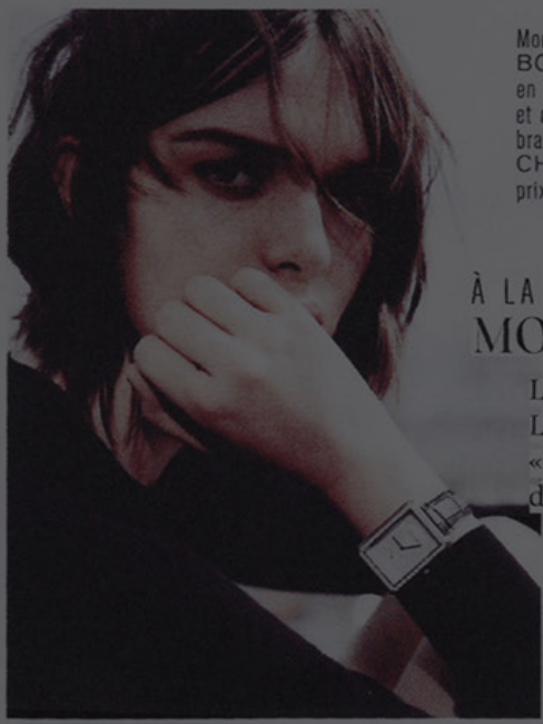
Montre BOYFRIEND, en or blanc et diamants, bracelet en alligator, CHANEL, prix sur demande.