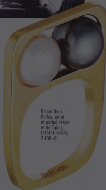
Bague Deux Perles, en or et perles akoya et de Tahiti. DINH VAN, 2 400 €.