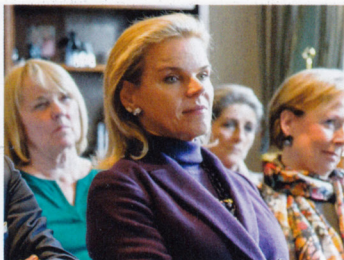
La princesse Samir Sabet d'Acre