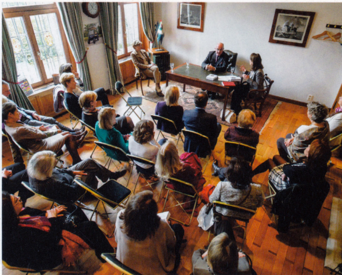
Les lecteurs de L'Eventail étaient nombreux à avoir répondu présents