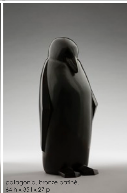
patagonia, bronze patiné. 64 h x 35 l x 27 p