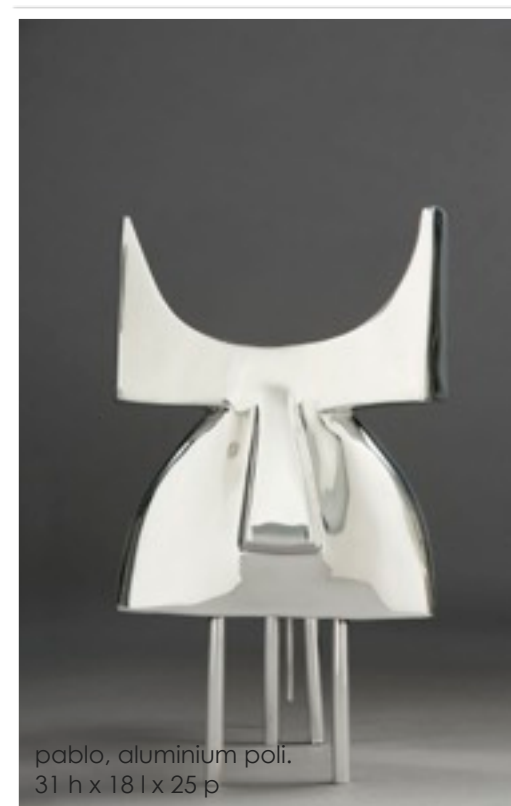
pablo, aluminium poli. 31 h x 18 l x 25 p