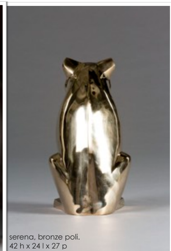
serena, bronze poli. 42 h x 24 l x 27 p

Vendredi 7 de 16 hs à 20 hs - Samedi 8 de 11 hs à 20 hs - Dimanche 9 de 16 hs à 20 hs Lundi 10 de 12 hs à 20 hs.